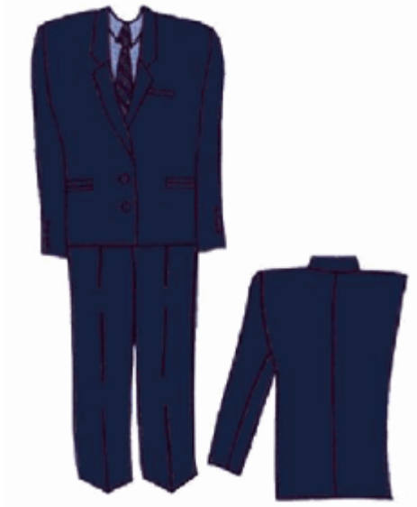
ANEXA nr. 7: UNIFORMA FEMEI